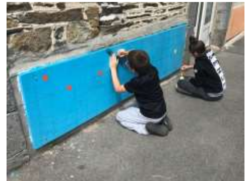
La cour de l'école, jeux et activités...