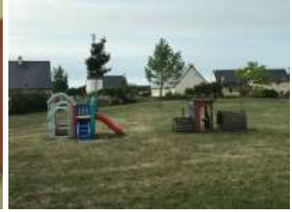
Une salle de classe la salle de motricité la cour arrière